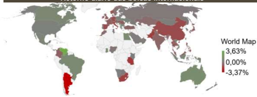
*Performance referente ao fechamento do dia anterior no caso de bolsas fechadas são considerados os índices futuros

Bolsas asiáticas em queda: Mercados asiáticos iniciaram a semana no campo negativo, enquanto investidores continuam atentos ao impacto de uma crescente disputa comercial entre EUA e China. O presidente dos EUA, Donald Trump, voltou a usar o Twitter ontem para ameaçar com novas medidas retaliatórias países que não retirarem "barreiras artificiais" contra produtos americanos. Além disso, há relatos de que Trump se prepara para anunciar nesta semana a restrição de investimentos da China em empresas americanas.