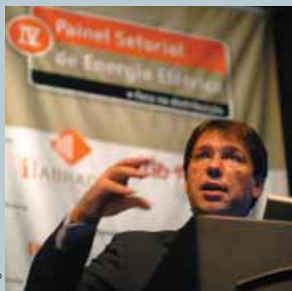
Wilson no Painel Setorial

A CPFL Energia esteve no "TV Painel Setorial de Energia Elétrica", realizado pela APIMEC SP (Associação dos Analistas e Profissionais de Investimento do Mercado de Capitais) e pela Abradee, no dia 8 de outubro, em São Paulo.