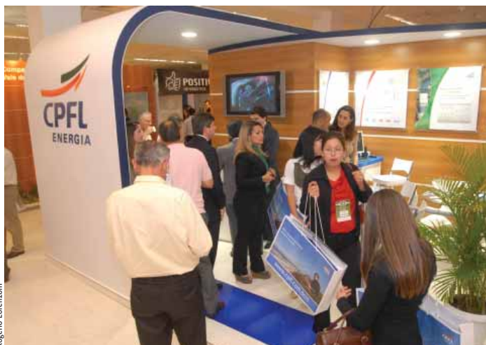
Estande da CPFL Energia recebeu centenas de investidores