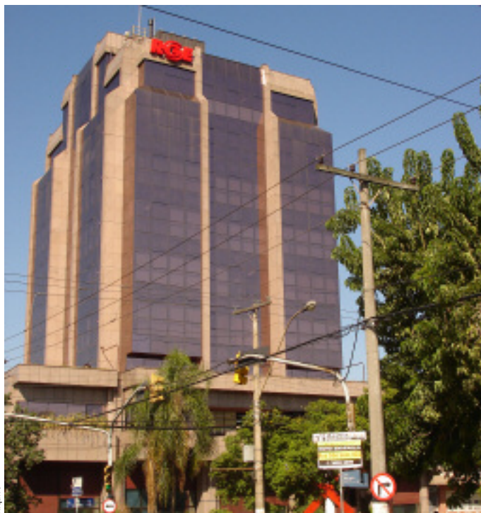
Sede da RGE, em Porto Alegre

O valor pago pela aquisição da Ipê Energia Ltda., da PSEG Brasil Ltda. e da PSEG Trader S.A. foi de US$ 185 milhões - que inclui como principal ativo a participação de 32,69% da RGE. A aquisição prevê um