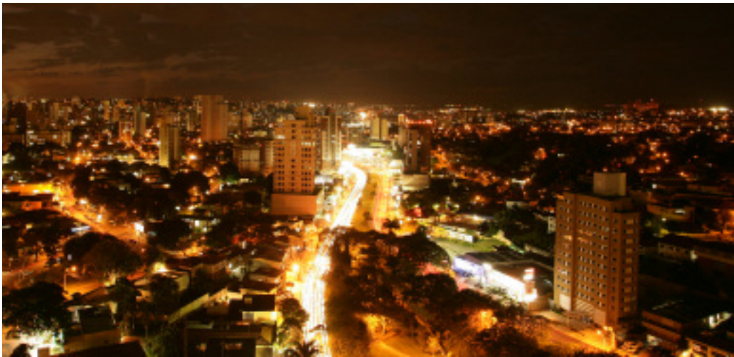
Campinas: uma das principais cidades atendidas pela CPFL

O lucro líquido acumulado da CPFL Energia nos nove primeiros meses de 2005 foi de R$ 640,6 milhões, dos quais R$ 240 milhões foram realizados no terceiro trimestre deste ano. O resultado deste período é muito superior ao obtido no mesmo período do ano passa-