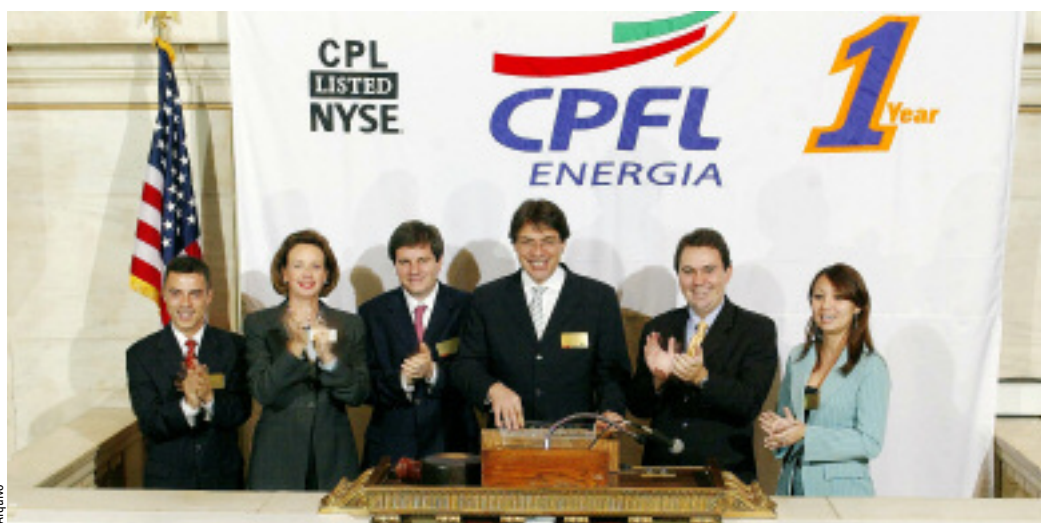
Executivos da CPFL Energia comemoram 1 ano de negociações em bolsas