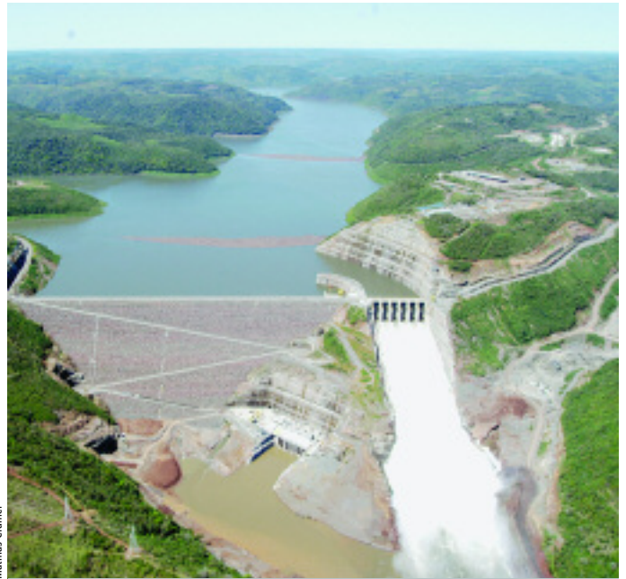
Barra Grande: em operação desde 1º de novembro

localiza-se às margens do rio Pelotas, entre as cidades de Anita Garibaldi (SC) e Pinhal da Serra (RS), na divisa de Santa Catarina com o Rio Grande do Sul. Com a operação total da hidrelétrica, a CPFL Geração terá uma receita adicional com a energia gerada de R$ 102,2 milhões por ano.